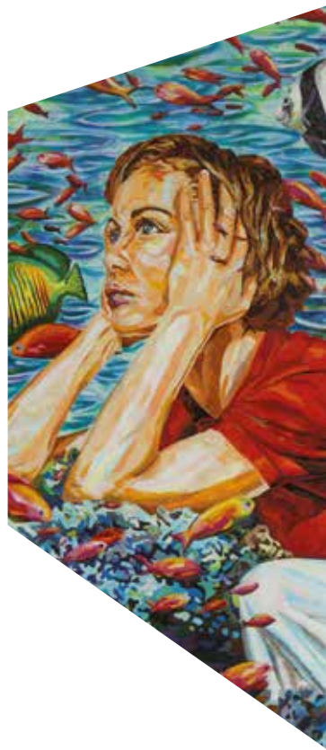
Nahtlose Fusion von Kunst und Leben